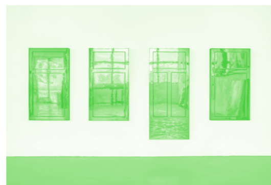
Scenery (Our house), 2021, carwrapfoil on wooden panels, 294 x 711 cm